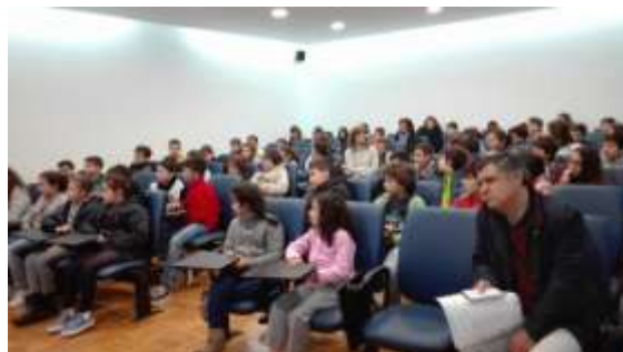
Escola Básica da Areosa